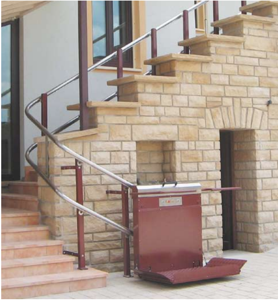
PLATE-FORME ÉLÉVATRICE POUR ESCALIER COURBE GTL30

La plate-forme qui ne connaît pas de limite : un équipement ergonomique et sûr qui s'adapte partout !