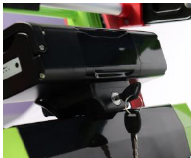
Clé de verrouillage batterie