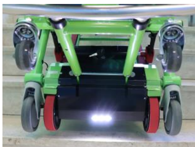
Eclairage des marches par LED