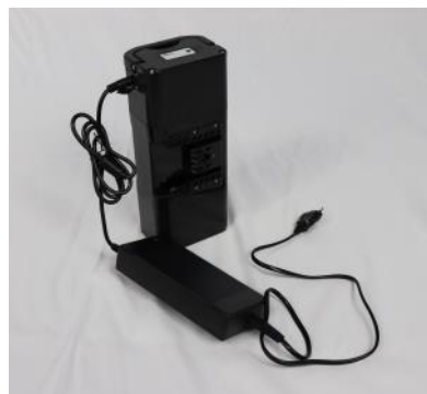
Batterie et chargeur inclus

La chaise d'évacuation EXCEL-E monte et descend les escaliers grâce à ses chenillettes motorisées. Ainsi l'évacuation des personnes travaillant en sous sol est désormais possible !